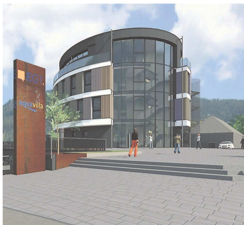
Der Neubau, der vor allem hinsichtlich Energieeffizienz und Nachhaltigkeit ein Vorzeigebauwerk in der Region geworden ist, wurde innerhalb von 15 Monaten in St. Georgen realisiert. Grafiken/Foto: Ketterer-Architekten (2)/Katja Wickert (1)

Mit dem Richtspruch der Zimmererleute und einem Vesper am Bau wird das neue Gebäude am Montag, 3. Juli, um 16.30 Uhr eingeweiht.