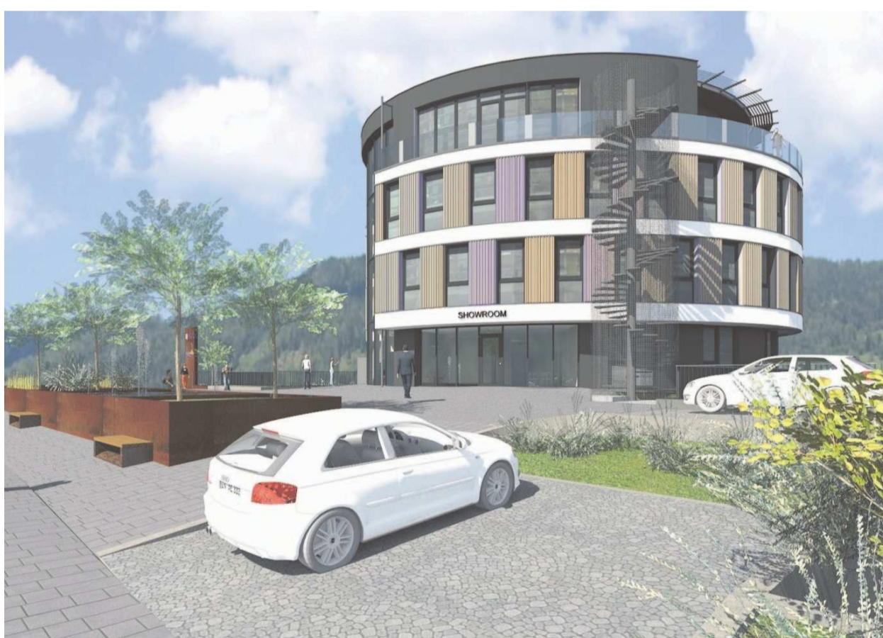
In direkter Nähe des neuen EGT-Gebäudes soll eine Schnellladesäule mit drei Ladepunkten errichtet werden.

Direkt beim neuen Gebäude wird die EGT Energie GmbH auch eine öffentliche Multi-Standard Schnellladesäule „Ultra Fast Charger“ mit drei Ladepunkten installieren, die elfte Ladesäule im Netzgebiet der EGT Energie GmbH. Das neue Gebäude wird der EGT Energie GmbH zukünftig unter anderem als Mobilitätsstützpunkt für den Netzbetrieb dienen.